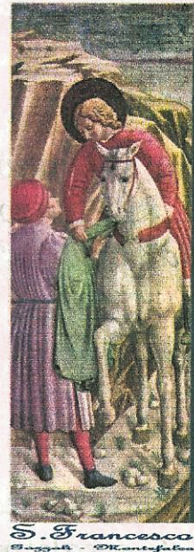
S. Francesco Bagnoli - Montefalco

Cavalieri e Cavaliere i fedeli difensori della giustizia e di ogni più santo ideale.